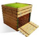
Самодельный деревянный компостер

Компостер можно приобрести готовый, а можно сделать самому