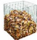
Самодельный компостер из проволоки